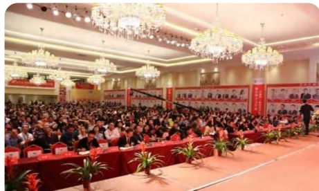
第三届国际培训产品博览会 2014.11.28-30 2200余人 深圳金茂园酒店