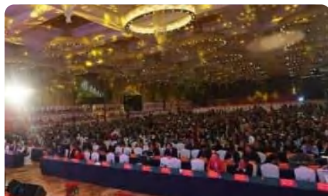
第五届国际培训产品博览会 2016.11.28-30 5000余人 昆山皇冠假日酒店