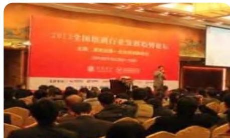
第一届国际培训产品博览会 2012.11.28-29 1200余人 杭州海外海纳天大酒店