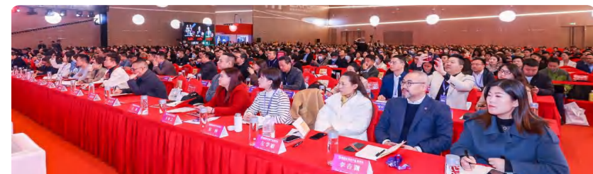
第12届国际培训产品博览会 2023.11.17-19 8000余人 上海张江科学会堂