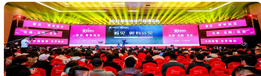
第10届国际培训产品博览会 2021.12.17-18 8000余人 北京九华国际会展中心