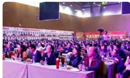
第四届国际培训产品博览会 2015.11.28-30 5000余人 北京温都水城