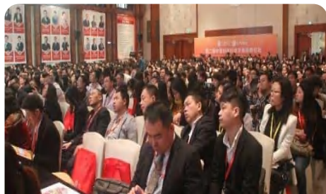
第二届国际培训产品博览会 2013.11.28-30 2200余人 深圳文博宫