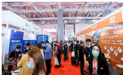
9M 2 标准配置