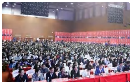
第七届国际培训产品博览会 2018.11.28-30 6000余人 北京温都水城