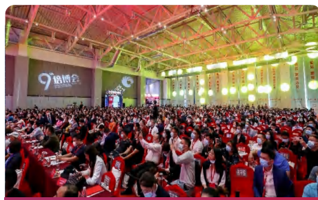
第九届国际培训产品博览会 2020.11.12-14 12000余人 深圳坪山国际会展中心